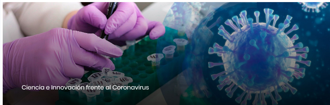
Ciencia e Innovación frente al Coronavirus

Más información: Nota de prensa y Real Decreto-ley