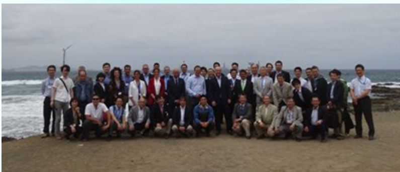
Delegación japonesa en su visita a España

La delegación japonesa, encabezada por NEDO y la Asociación Japonesa JWPA (Japan Wind Power Association), ha estado compuesta por 40 representantes de 24 entidades industriales y académicas vinculadas al sector eólico en Japón. Durante el Workshop, tanto ponentes españoles como japoneses han presentado sus experiencias en los proyectos de demostración más relevantes, así como sus próximos desafíos tecnológicos en el ámbito de la energía eólica offshore. El Workshop ha congregado también a más de 120 representantes de empresas españolas. Tras el Workshop la delegación japonesa aprovechó su estancia para visitar algunas empresas como Haizea Wind, Vicinay o Siemens-Gamesa.