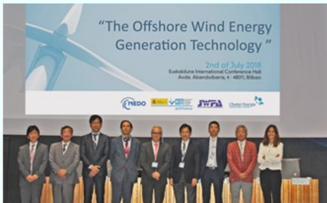
Algunos de los ponentes del Workshop celebrado en Bilbao

El CDTI y su agencia homóloga japonesa, NEDO, en colaboración con el Cluster de Energía, han organizado su 8º Workshop Tecnológico Conjunto, el día 2 de Julio, en Bilbao, en el ámbito de la Energía Eólica Offshore.