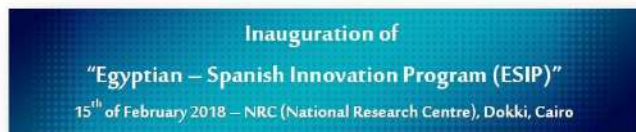
STDF Workshop in Collaboration with Embassy of Spain in Cairo – Economic & Commercial Office