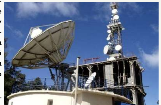
Primera estación experimental de radio digital terrestre.

Para la estación de TDA, gracias a este modo de difusión, todos los emisores de la misma región pueden operar en la misma frecuencia y habilitar la planificación de la misma, mencionando también cualquier servicio adicional, es decir, la visualización del título rastreado, la guía del programa, la información sobre el programa actual y la información de la carretera de radio a bordo.