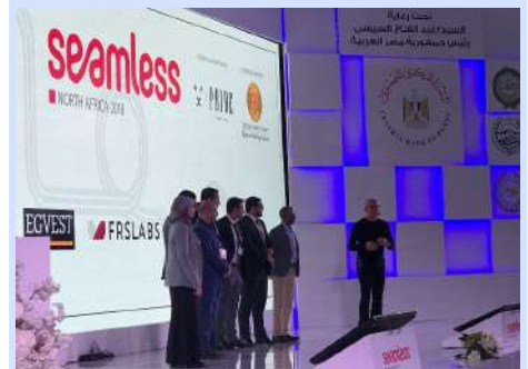
Sesión celebrada durante la conferencia de Tecnología Financiera (FinTech).

El gobernador del Banco Central de Egipto (CBE), Tarek Amer, dijo que el lanzamiento del fondo respaldará la innovación, según su discurso en el segundo día de la conferencia de Tecnología Financiera (FinTech) "Seamless North Africa". De acuerdo con la agenda de la conferencia, el discurso de Tarek Amer se titulaba "Transformar a Egipto en el próximo centro internacional de innovación y el futuro de FinTech en Egipto".