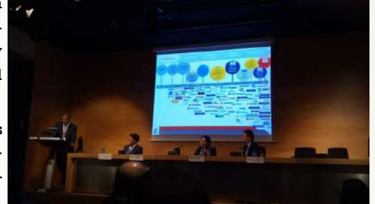
Feria Intergune, Bilbao, País Vasco

Por la tarde, hubo tiempo para conocer las oportunidades de negocio que existen actualmente en Emiratos Árabes Unidos y otros países de la Península Arábiga en sectores como el de Infraestructuras (transporte, agua, construcción y proyectos industriales), Bienes de consumo y Energía (renovables y oil & gas). La cooperación en I+D con EAU, así como con otros países de la zona MENA como Argelia, Marruecos, Túnez, Egipto, Jordania, Líbano, Catar, Kuwait, Irán y Arabia Saudita, es posible gracias a la Convocatoria de Proyectos Bilaterales de Certificación y seguimiento UNILATERAL lanzada por CDTI.