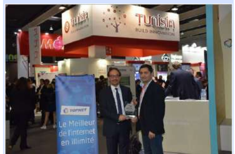
TOPNET en MWC 2018.