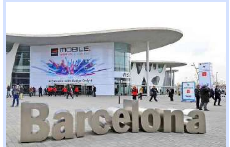
MWC 2018 Barcelona.

Puede consultar el listado de todas las empresas por país aquí .